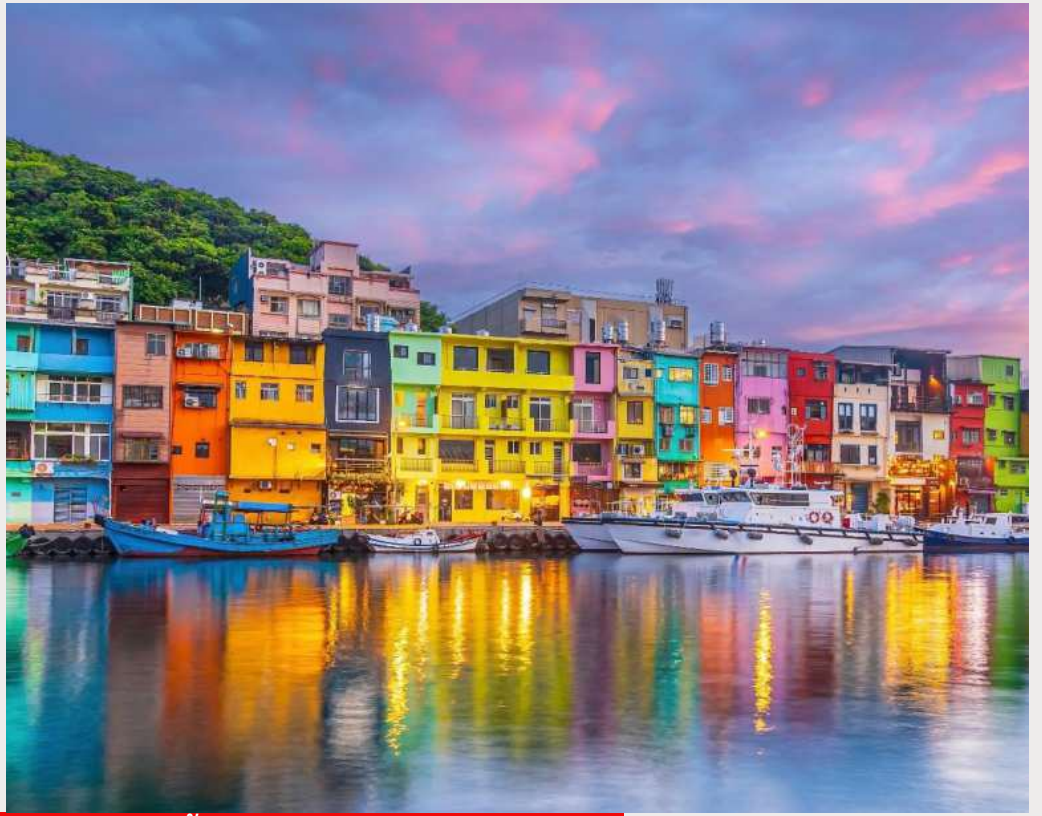
ท่าเรือประมงเจิ้งปิน (Zhengbin Fishing Port)

จากนั้นนำท่านเดินทางสู่ ถนนโบราณจิ่วเฟิ่น (Jiufen Old Street) ตั้งอยู่บนเขา ทิวทัศน์ภาพสวยงาม ด้านหลังเป็นภูเขา ด้านหน้าเป็นวิวทะเลสีทอง แต่เดิมเคยเป็นหมู่บ้านเล็กๆ ที่โอบล้อมด้วยทิวเขา และมองเห็นท้องทะเลอยู่ลิบๆ หมู่บ้านแห่งนี้อดีตเคยเป็นเมืองทองคำที่มีชื่อเสียงตั้งแต่สมัยกษัตริย์กวางสวี่ แห่งราชวงศ์ชิง โดยตั้งแต่ช่วงปี ค.ศ. 1890 ได้มีการสำรวจพบแร่ทองคำ ญี่ปุ่นที่เป็นผู้ครอบครองได้หวั่นขณะนั้น ได้เนรมิตให้ที่นี่เป็นเมืองทอง โดยใช้แรงงานหลักคือเชลยศึก ซึ่งนำมาซึ่งความมั่งคั่งและคึกคักให้กับเมือง แต่เมื่อแร่ทองคำร่อยหรอ จนบริษัทเอกชนของไต้หวันที่มารับช่วงต่อในช่วงปี ค.ศ. 1987 ต้องประสบภาวะขาดทุนจนต้องปิดกิจการไปในที่สุด จนเป็นแรงบันดาลใจให้ผู้สร้างของญี่ปุ่นอย่างสตูดิโอจิบลิ ได้ใช้เป็นฉากหลังของหนังการ์ตูนที่โด่งดังจนคว่ำรางวัลออสการ์มาครองในปี 2002 กับเรื่อง “SPIRIT AWAY” นอกจากนี้ภายในหมู่บ้านที่เต็มไปด้วยอาคารโบราณย้อนยุคอันเป็นเสน่ห์หลักของเมืองนี้ ทั้งสองข้างทาง มีสินค้าน่าชายนอยู่มากมาย ไม่ว่าจะเป็น ของที่ระลึก อาหารท้องถิ่น ชุดเสื้อผ้าที่เพ้า ร้านอาหาร เป็นต้น (โดยสารรถประจำทางขึ้นไป)