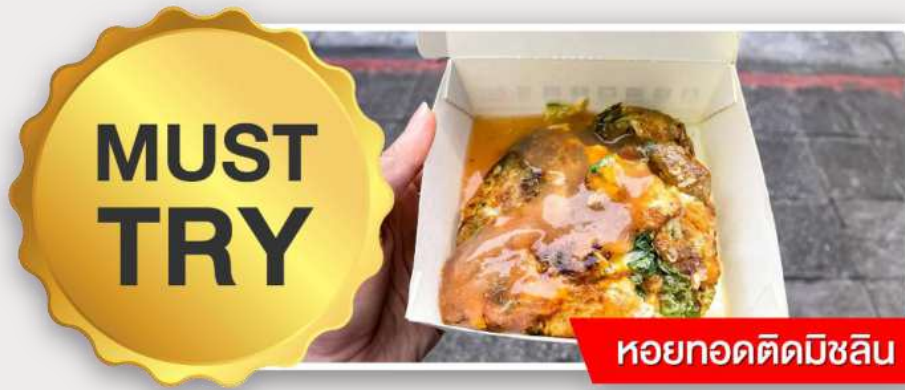
หอยทอดติดมิชลิน

อิสระอาหารเย็นตามอัธยาศัย ณ ตลาดกลางคืนหนิงเซี่ย