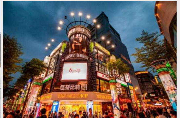
ตลาดกลางคืนซีเหมินติง (Ximending Night Market)

เย็น อิสระอาหารเย็นตามอัธยาศัย ณ ตลาดกลางคืนซีเหมินติง