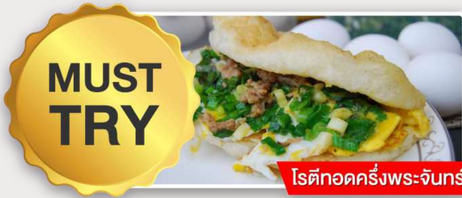
ไต้กอดครึ่งพระจันทร์

อิสระอาหารเย็นตามอัธยาศัย ณ ตลาดกลางคืนอิง