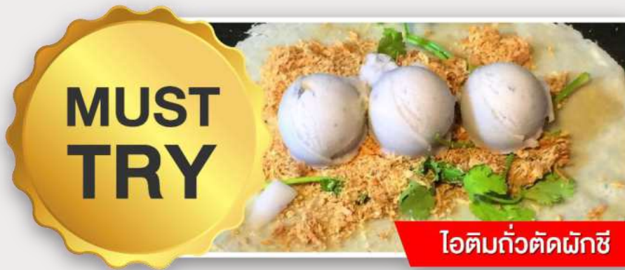
ไอติมแก้วตัดผักชี

นำท่านเดินทางกลับสู่ กรุงไทเป (TAIPEI CITY) ให้ท่านพักผ่อนและชมวิวทิวทัศน์สองข้างทางบนรถ (ใช้เวลาเดินทางประมาณ 1 ชั่วโมง)