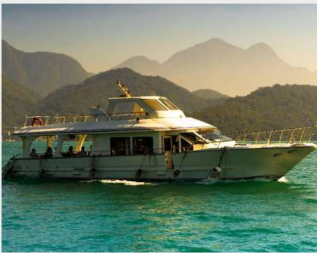
ล่องเรือทะเลสาบสุริยันจันทรา (Sun Moon Lake)

นำท่านเดินทางสู่ วัดพระถังซัมจั๋ง (Xuanguang Temple) นมัสการพระอัฐิของพระพุทธเจ้าที่อันเชิญมาจากชมพูทวีป เป็นอีกวัดหนึ่งที่ต้องมาเยือนหากได้มาที่ทะเลสาบสุริยันจันทรา วัดนี้มีรูปปั้นพระถังซัมจั๋งให้นมัสการ อีกทั้งมีวิวทะเลสาบที่สวยงาม และพิพิธภัณฑที่จัดแสดงประวัติของพระถังซัมจั๋ง ภายในวัดมีบรรยากาศที่สวยงาม เงียบสงบ