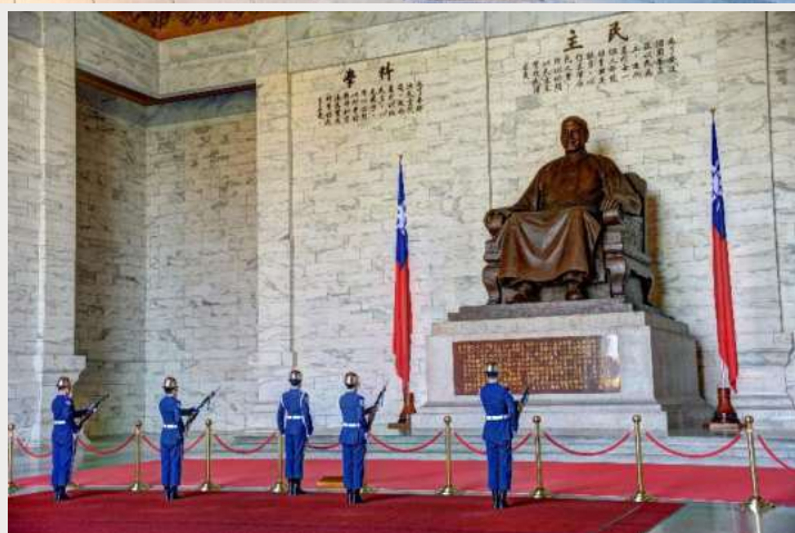
อนุสรณ์สถานเจียงไคเช็ค (Chiang Kai-Shek Memorial Hall)

จากนั้นนำท่านถ่ายรูปกับ ตึกไทเป 101 (Taipei 101) ตึกระฟ้าที่สูงที่สุดในไต้หวัน และเคยเป็นตึกที่สูงที่สุดในโลกในปี ค.ศ. 2004 ความสูงจากพื้นดิน 509.2 เมตร มีทั้งหมด 101 ชั้น ชั้น 1-5 จะเป็น ส่วนของห้องสรรพสินค้าและร้านอาหารต่างๆ โดยมีสินค้ามากมายให้ท่านเลือกซื้อป ทั้งสินค้าทั่วไป