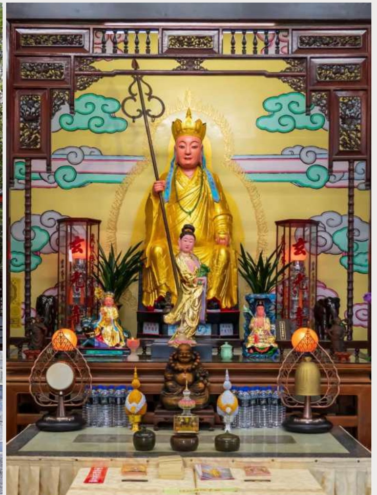
วัดพระถังซำจั๋ง (Xuanguang Temple)

นำท่านเดินทางสู่ กรุงไทเป (TAIPEI CITY) เมืองหลวงของไต้หวัน ศูนย์กลางทางการเมือง การปกครอง เศรษฐกิจ การค้า และวัฒนธรรมที่หลากหลาย มีประชากรประมาณ 2.6 ล้านคน กรุงไทเปถูกสร้างขึ้นตั้งแต่ปลายศตวรรษที่ 19 สมัยราชวงศ์ชิง มีอายุกว่า 130 ปีมาแล้ว แต่ยังคงรักษาไว้ซึ่งวัฒนธรรมอันเก่าแก่ อย่างเช่น โบราณสถาน ถนนสายเก่า และวัดวาอาราม ที่มีคุณค่าทางประวัติศาสตร์อยู่มากมาย ปัจจุบันไทเปเป็นหนึ่งในเมืองขนาดใหญ่ในทวีปเอเชียที่มีย่านการค้าที่มีชื่อเสียง มีอาหารนานาชาติ บรรยากาศยามค่ำคืนที่คึกคัก และระบบคมนาคมขนส่งสาธารณะที่มีประสิทธิภาพ รวมถึงเป็นที่ตั้งของตึก Taipei 101 ซึ่งเคยเป็นตึกที่สูงที่สุดในโลก และมีสถานที่ท่องเที่ยว ทั้งทางธรรมชาติและวัฒนธรรมอีกมากมาย (ใช้เวลาเดินทางประมาณ 3 ชั่วโมง 30 นาที)