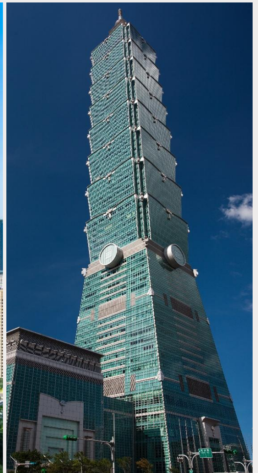
ตึกไทเป 101 (Taipei 101)