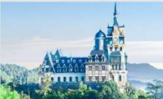
ปราสาทตามด้าว