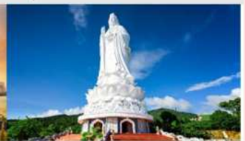
วัดลินห์ฮ้าง

*ทางบริษัทฯ ขอสงวนสิทธิ์ในการสลับโปรแกรมทัวร์ตามความเหมาะสมขึ้นอยู่กับสถานการณ์หน้างาน โดยคำนึงถึงผลประโยชน์ของลูกค้าเป็นสำคัญ