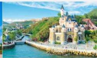
สวนสนุกวินเดอร์ส

*ทางบริษัทฯ ขอสงวนสิทธิ์ในการสลับโปรแกรมทัวร์ตามความเหมาะสมขึ้นอยู่กับสถานการณ์หน้างาน โดยคำนึงถึงผลประโยชน์ของลูกค้าเป็นสำคัญ