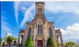
โบสถ์หินญางอง