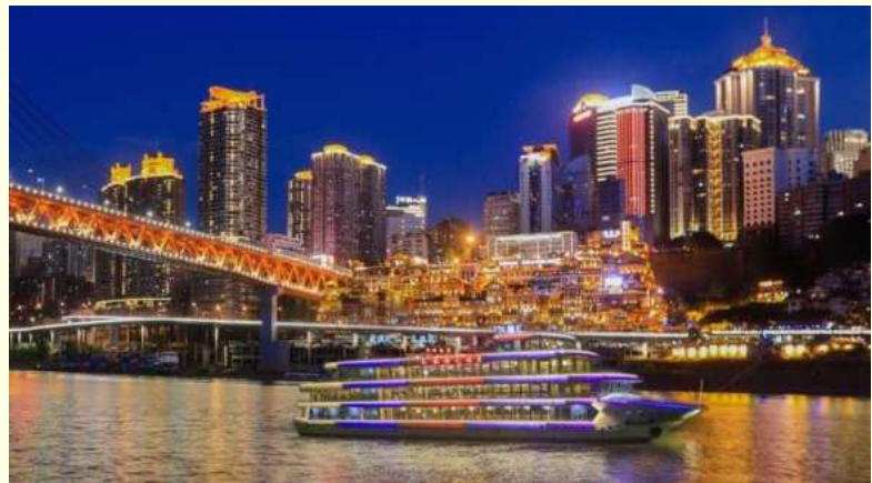
Option เสริม ล่องเรือราตรีชมแม่น้ำสองสาย

*ราคาทัวร์นี้ยังไม่รวมค่าบริการค่าล่องเรือ สำหรับท่านที่สนใจจะมีค่าบริการท่านละ 300 หยวน (ราคาอาจมีการเปลี่ยนแปลง กรุณาตรวจสอบราคาก่อนซื้ออีกครั้ง)*